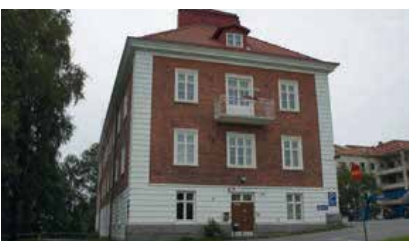
Koukkuniemen hallintorakennus, Tampere