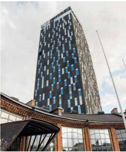
Hotelli Tori, Tampere