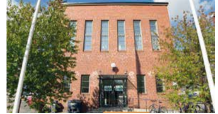
Tampereen Sähkölaitos, Tampere