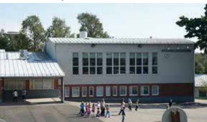
Matinkylän koulukeskus, Espoo