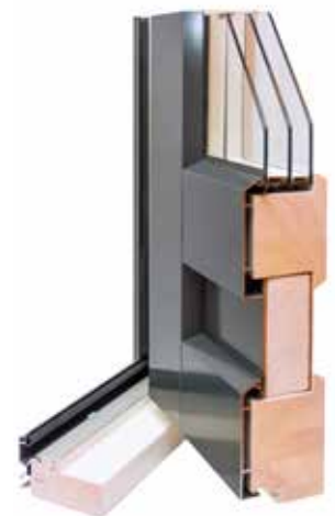
Parvekeovi REPO 80 mm

Markkinoiden vahvin liimaamalla sormijatketuista lamelleista tehty kehäpuurunko. Tuulettuva alumiiniverhous kiinnitetty kestävin alumiinikiinnikkein. 3K-lasitus ja EPS-eriste. Kynnyksen myrskylista ja vedenohjauslista kestävää alumiinia.