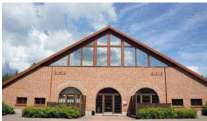
Linna Golf, Hämeenlinna