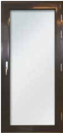
EPO-A-kokolasiovi EPO-A 2LP