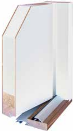
Lämpöulko-ovi 70 mm