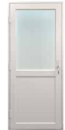
EPO-A 39 DB