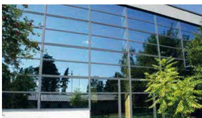
Martinlaakson tenniskeskus, Espoo