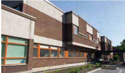
Meri-Porin yhtenäiskoulu, Pori