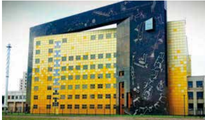
Eremitaasin restaurointi- ja varastokeskus