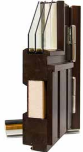
Parvekeovi EPO 70 mm

Sormijatketuista lamelleista liimaamalla tehty kehäpuurunko on markkinoiden vahvin. Paneeli on pintakäsitelty ennen kokoonpanoa. 3K-lasitus ja EPS-eriste. Kynnyksessä kulutusta kestävä alumiininen päällilista ja kynnyksen etulistassa kätevä snap-in-kita kynnykspellin kiinnitykseen.