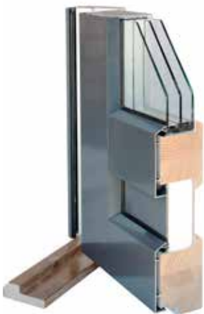
Parvekeovi SEPO 80 mm

Sormijatketuista lamelleista liimaamalla tehty markkinoiden vahvin kehäpuurunko. Tuulettuva alumiiniverhous kiinnitetty kestävin alumiinikiinnikkein. 3K-lasitus ja EPS-eriste. Kynnys kuullotettua koivua.