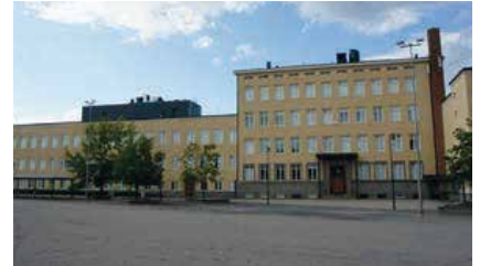
Nekalan koulu, Tampere