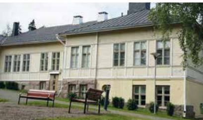
Pertulan Erityisammattikoulu, Hämeenlinna