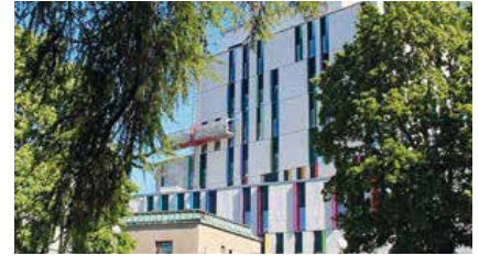
Uusi Lastensairaala, Helsinki