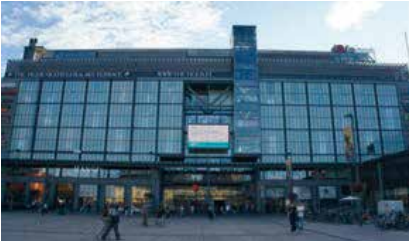
Kauppakeskus Kamppi, Helsinki