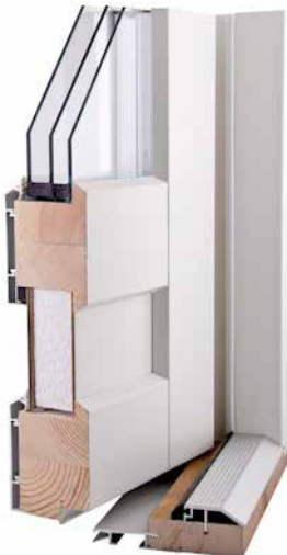
Parvekeovi EPO-A 80 mm

Sormijatketuista lamelleista liimaamalla tehty kehäpuurunko on markkinoiden vahvin. Tuulettuva alumiiniverhous kiinnitetty kestävin alumiinikiinnikkein. 3K-lasitus ja EPS-eriste. Kynnyksessä kulutusta kestävä alumiininen päällilista ja kynnyksen etulistassa kätevä snap-in-kita kynnykspellin kiinnitykseen.