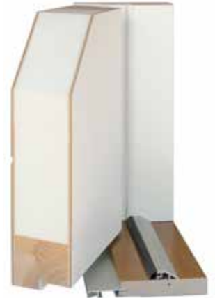
Lämpöulko-ovi 90 mm

Säänkestävä HDF-levy, alumiinijäykiste ja tukiviilu molemmin puolin. Tuplarunkorakenne ja EPS-eristys. Kynnyksessä kulutusta kestävä alumiininen päällilista ja kynnyksen etulistassa kätevä snap-in-kita kynnykspellin kiinnitykseen. 90 mm lämpövirakenteesta saatavilla myös ääneneristys- ja paloeristysrakenteet.