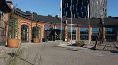
Veturitalit, Hotelli Tori, Tampere